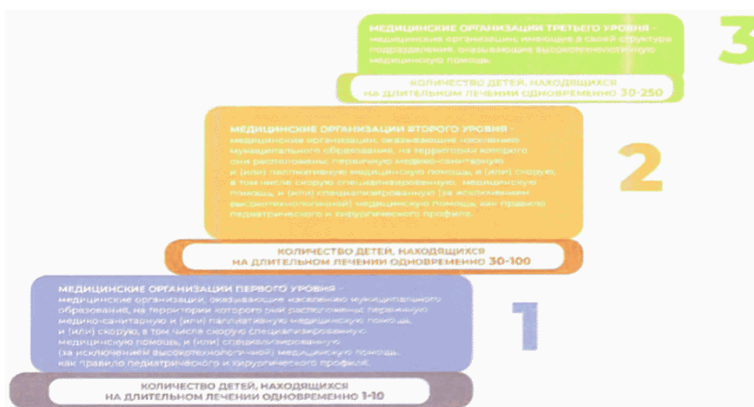
Схема N 2