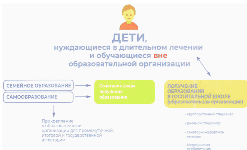
Схема N 3