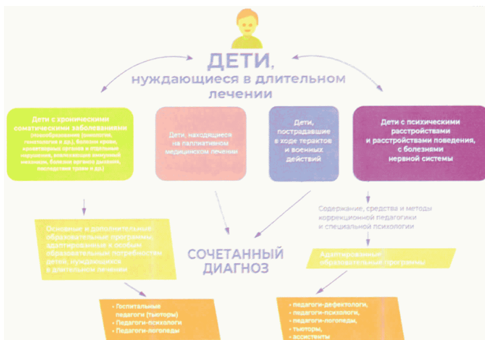
Приложение N 3 к Разъяснениям