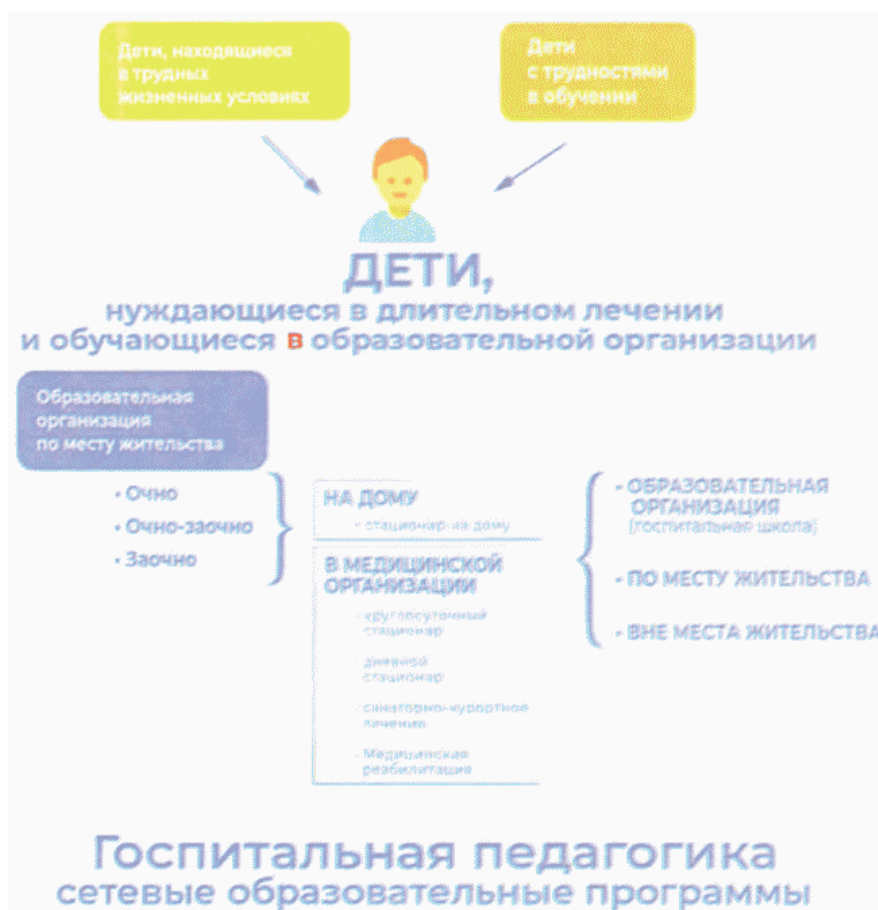
Схема N 2